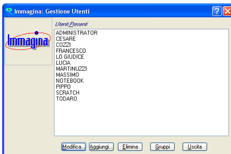
Fig. 6.1 – La finestra principale del modulo Gestione Utenti

Il modulo Gestione Utenti , accessibile tramite l'omonimo bottone della finestra principale del modulo di amministrazione, si presenta all'amministratore come in Fig. 6.1.