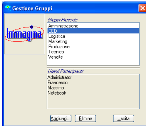
Fig. 6.7 – Elenco degli utenti appartenenti al gruppo CED

Con il comando Aggiungi è possibile creare un nuovo gruppo. La selezione del comando conduce l'utente alla finestra di Fig. 6.8.