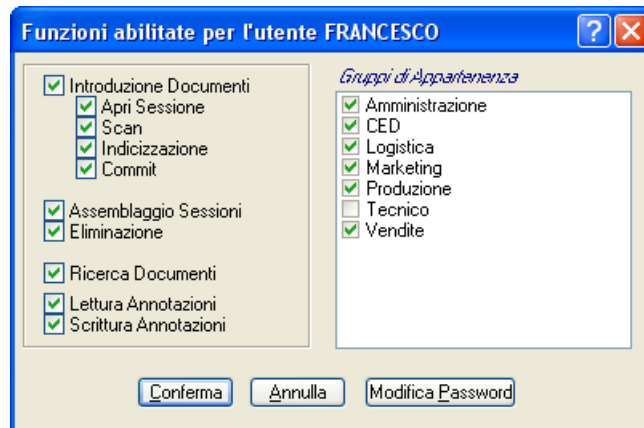
Fig. 6.4 – Modifica del profilo dell'utente dell'esempio di Fig. 6.2