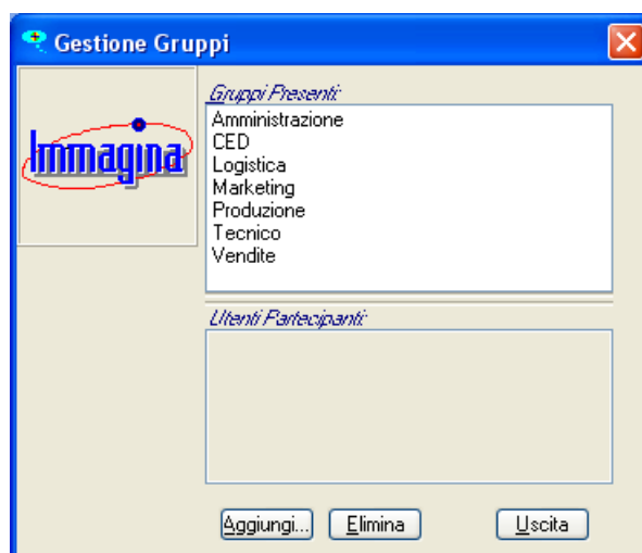
Fig. 6.6 – La finestra di gestione dei Gruppi

Il concetto di gruppo permette di dare accesso ad un archivio ad utenti con mansioni o necessità assimilabili.