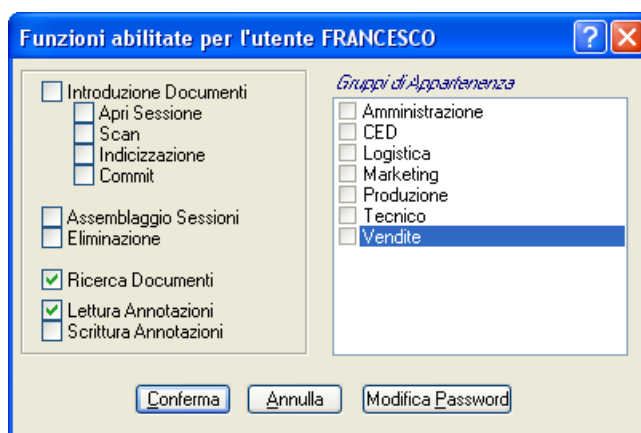
Fig. 6.2 – La finestra di gestione delle abilitazioni degli utenti

Nell'esempio raffigurato l'utente Francesco è abilitato alla sola ricerca dei documenti e alla lettura delle annotazioni (caso tipico, come si è visto nel secondo capitolo del presente manuale, della creazione automatica di un utente in fase di installazione di un client di «Immagina»).