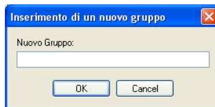
Fig. 6.8 – Creazione di un nuovo gruppo

Con il comando Aggiungi è possibile creare un nuovo gruppo. La selezione del comando conduce l'utente alla finestra di Fig. 6.8.