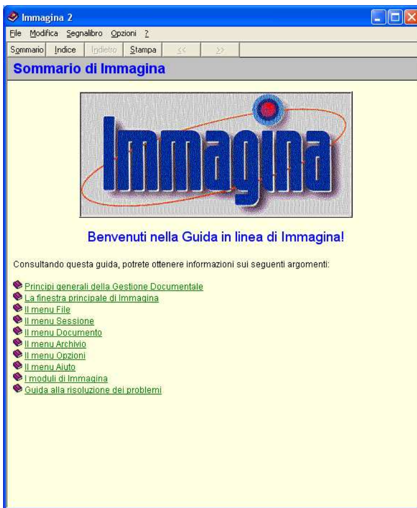
Fig. 8.2 - Il sommario della Guida in linea di «Immagina»

La Guida si presenta all'utente con un aspetto analogo a quello di un libro. Il sommario presenta una serie di argomenti che l'utente può selezionare con il mouse, semplicemente posizionandosi sopra e premendo il bottone sinistro. Si noti che il cursore, in certe posizioni dello schermo, cambia aspetto, trasformandosi in una mano. Tale cambiamento di forma ha il ruolo di permettere all'utente di individuare con precisione quali elementi possono essere selezionati.